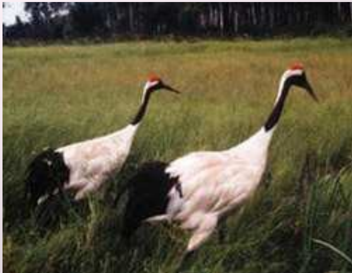
Журавы ляцяць клінам