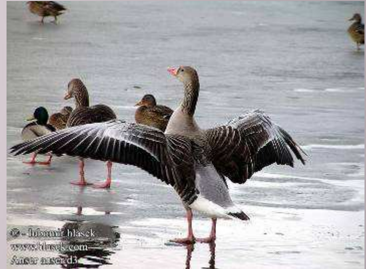
Чаплі ды гусі ляцяць чарадой